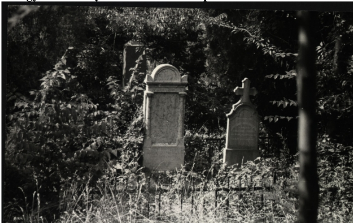
A Crouy-Chanel család sírhelye ma is megtalálható a péceli református temetőben