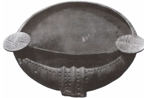
kultikus tárgy Kocsi alakú edény- Budakalász Ember alakú arcos urna